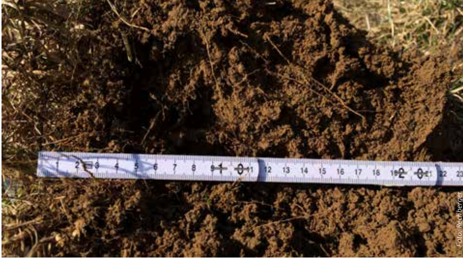
Überwinternde Gräseruntersaaten aus der Vorfrucht hinterlassen in der Regel eine sehr gute Bodenstruktur mit intensiver Lebendverbauung – optimale Voraussetzungen für erosionsstabile Böden. (Foto vom Versuchstandort Limberg bei Horn, 2021)