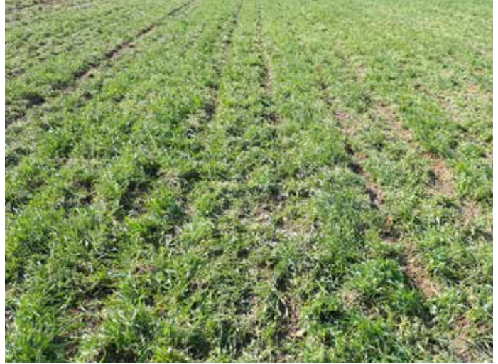
Der „Ground Cutter“ der Fa. CFS ermöglicht die Unterschneidung der Gründedecke ohne vorheriges Mulchen (links). Fast intakte Gründedecke nach dem Umbruch (rechts)