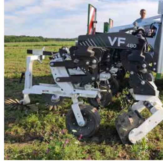
Der Zwischenreihenmulcher von Rohringer & Rossak im Einsatz am Projektstandort Gaubitsch bei Laa/Thaya.

erfolgte die Beikrautregulierung und Einkürzung des Lebendmulchbestandes einerseits mit einem neu entwickelten Zwischenreihenmulcher von Rohringer & Rossak ( www.kupferschmiede-rossak.at ). Andererseits kam ein adaptierter Variofield von Dickson-Kerner zum Einsatz. Der zweibalkige Aufbau erlaubt eine flexible Kombination von Messerwalzenelementen und Winkelmessern. Die Winkelmesser bearbeiten den Bereich unmittelbar an der jungen Maispflanze, im Zwischenreihenbereich soll der Lebendmulchbestand durch die Messerwalzenelemente im Wachstum eingebremst bzw. sukzessive zum Absterben gebracht werden.