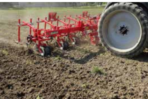
Das Hackgerät „Chopstar Twin“ von Einböck ermöglicht durch das geteilte Tastrad eine exakte Hackarbeit nahe der Reihe.