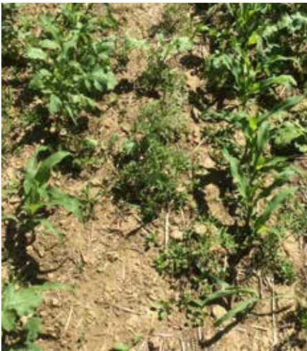
Bodenbedeckung bei der abfrostenden (links) und winterharten (rechts) Begrünung vor dem Hacken im Vergleich. Der Mais hat sich bei der abfrostenden Variante besser entwickelt, jedoch ist der Beikrautdruck extrem hoch.