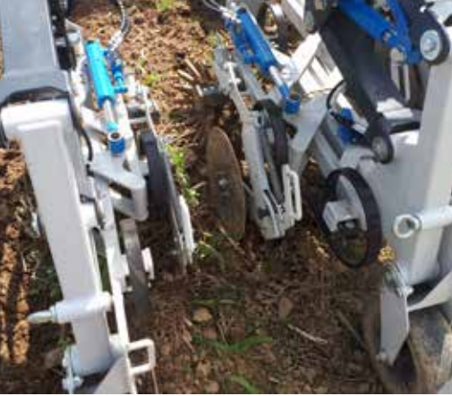
Die patentierte hydraulische Bandbreitenverstellung bei Hackgerät von SAMO ermöglicht eine Anpassung an wechselnde Bedingungen während der Fahrt.