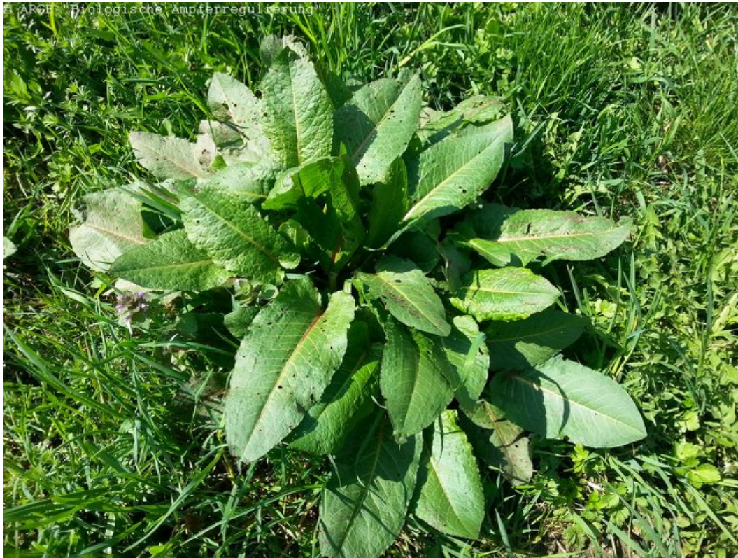
ARGE "Biologische Ampferregulierung"