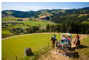
OÖ Tourismus, Erber

Mit den umgesetzten Projektmaßnahmen wurde auf den touristischen Leuchtturm „Wanderreiten“ sehr stark aufmerksam gemacht und dieser dadurch auch enorm gestärkt! Das Jahr des Pferdes ist Ausgangspunkt für eine Vielzahl an Aktivitäten in der Region, bei welchen in Summe weitaus mehr als 150 Menschen beteiligt waren und noch sein werden.