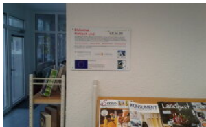
Region Großglockner/Mölltal - Oberes Drautal

Das Projekt wurde insgesamt sehr zufriedenstellend und erfolgreich umgesetzt. Der Projektablauf wurde durch die gute Planung und durch das gute Zusammenspiel mit den Firmen reibungslos abgewickelt.