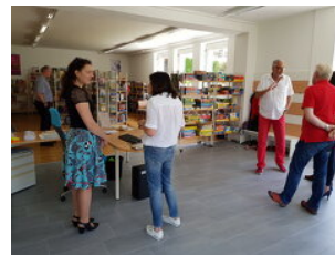
Region Großglockner/Mölltal - Oberes Drautal