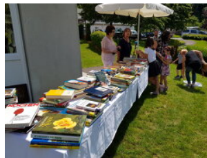
Region Großglockner/Mölltal - Oberes Drautal