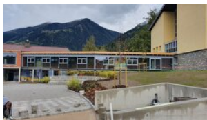
Region Großglockner/Mölltal - Oberes Drautal