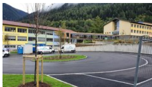
Region Großglockner/Mölltal - Oberes Drautal