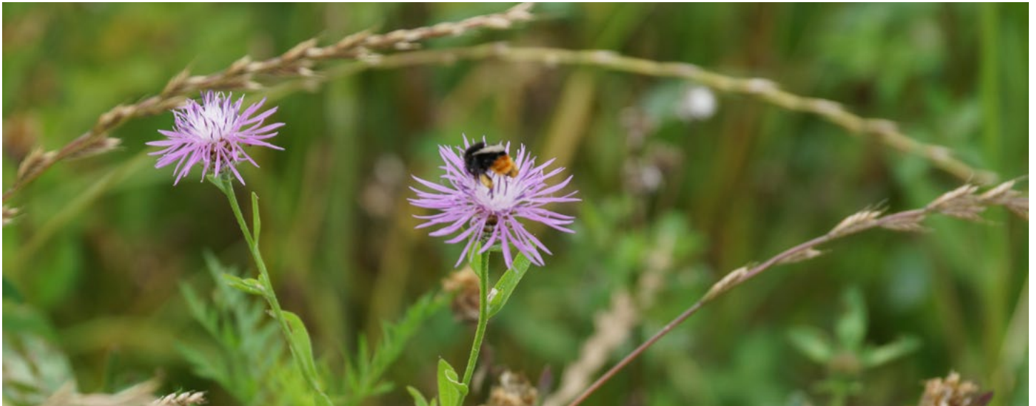
Hummel auf Flockenblume