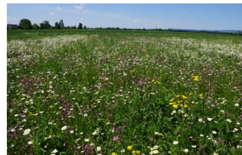
Oben: Franz Kastenhuber © Johanna Huber, unten: Blühfläche © Franz Kastenhuber