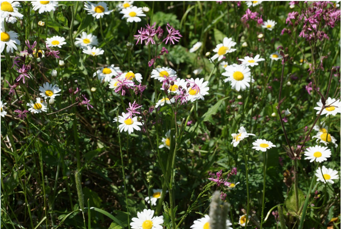
Blühfläche mit regionalem Saatgut

Regionales mehrjähriges und artenreiches Wildblumensaatgut ist besonders zu empfehlen, da es an die heimischen Standorte am besten angepasst ist. Wildblumenmischungen mit vielen mehrjährigen Arten werden am besten im Spätsommer angesät. Im ÖPUL wurde dafür eine optionale Auflage gestaltet, der zufolge mindestens 30 Arten aus 7 Pflanzenfamilien gemäß Artenliste angebaut werden müssen.