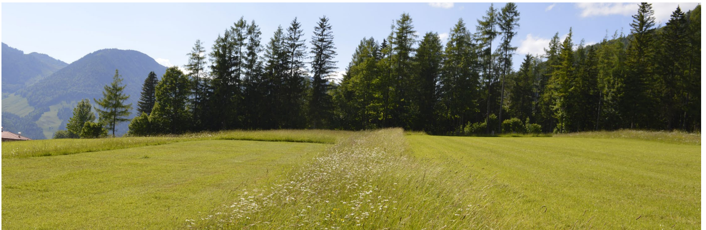
Biodiversitätsflächen sind wichtige Rückzugsorte für viele Pflanzen- und Tierarten.

Biodiversitätsflächen im Grünland werden weniger oft gemäht und gedüngt als üblich. Durch die extensive Bewirtschaftung ergeben sich Rückzugsorte für zahlreiche Pflanzen und Tiere , die einen längeren ungestörten Zeitraum für ihre Entwicklung benötigen.