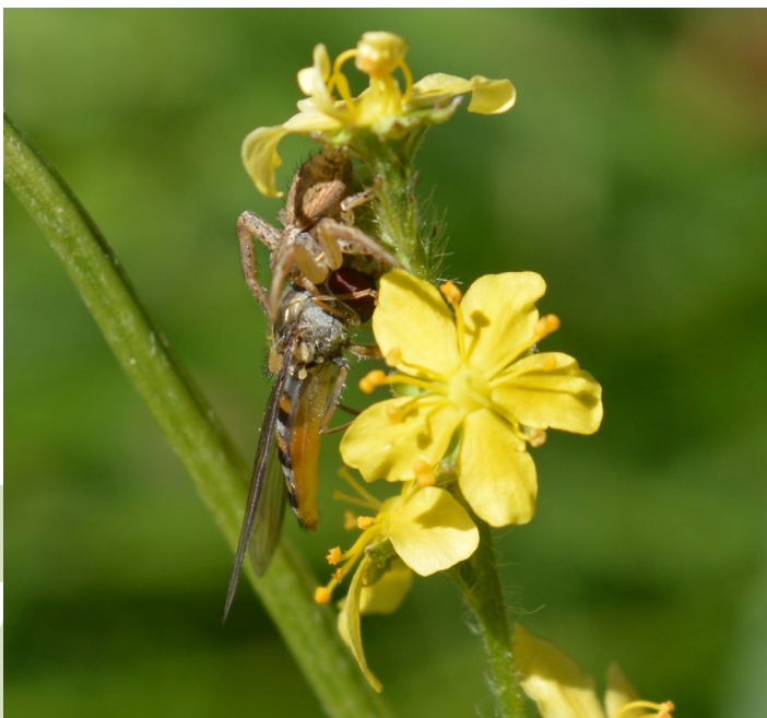
Spinne mit Schwebfliege

Von der verlängerten nutzungsfreien Zeit profitieren viele Tiere und Pflanzen, weil ihnen die Flächen in einer Zeit, in der intensivere Flächen häufiger gemäht werden, einen ungestörten Rückzugsraum bieten. Die Artenvielfalt bei Heuschrecken wird durch diese Variante besonders gefördert, weil sie auf solchen Wiesen ihren gesamten Entwicklungszyklus abschließen und sich vermehren können. Auch für blütenbesuchende Insekten sind die Flächen gerade im Hochsommer, wenn die Zahl der blühenden Pflanzen insgesamt zurückgeht, eine wichtige Nahrungsquelle .