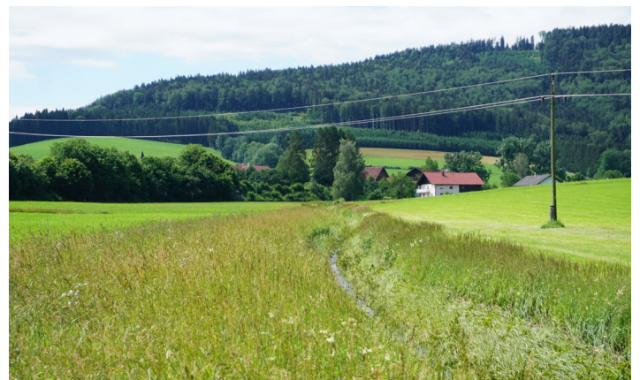
Links: Blühstreifen rund um einen Steinhaufen, rechts: Pufferstreifen zum Bach