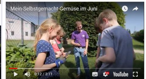
Mein Selbstgemacht Gemüse im Juni Die Kinder im Hort Anton-Kleinoscheg-Straße sind unter die Gärtner gegangen! Sie haben gemeinsam ein schönes Hochbeet gebaut und darin verschiedene Gemüsesor... YOUTUBE.COM